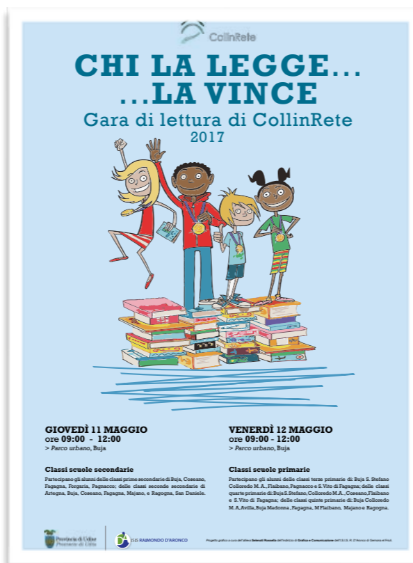
Manifesto "Chi la legge la vince" COLLINRETE