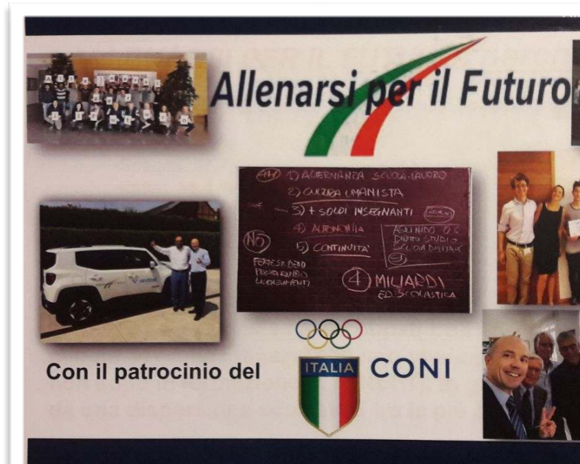
Allenarsi per il futuro