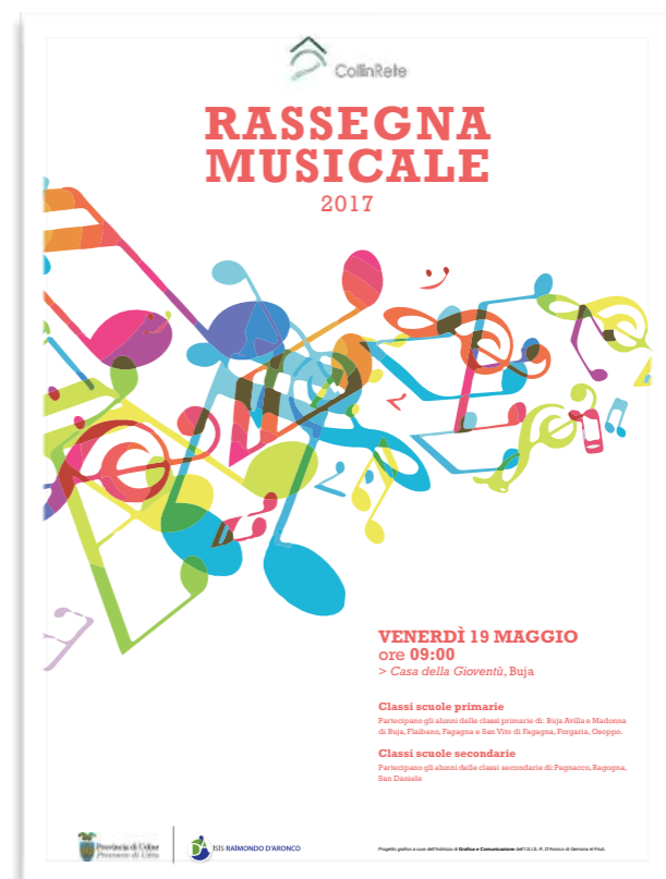
Manifesto "Rassegna musicale" COLLINRETE