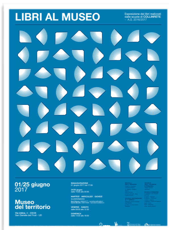
Manifesto "Chi la legge la vince" COLLINRETE