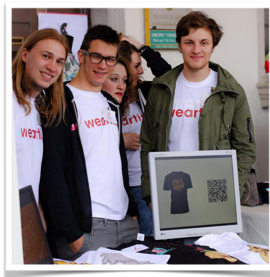
Impresa in azione WE ARTIST