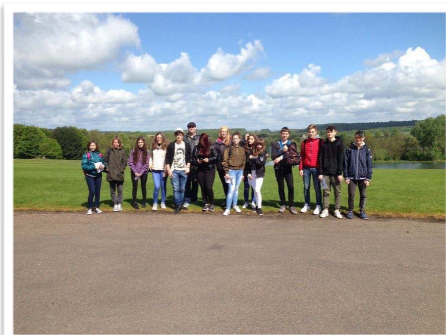
Stage linguistico a YORK