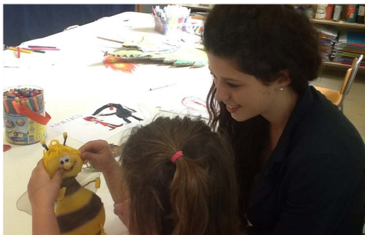
Visita alla Scuola dell'Infanzia