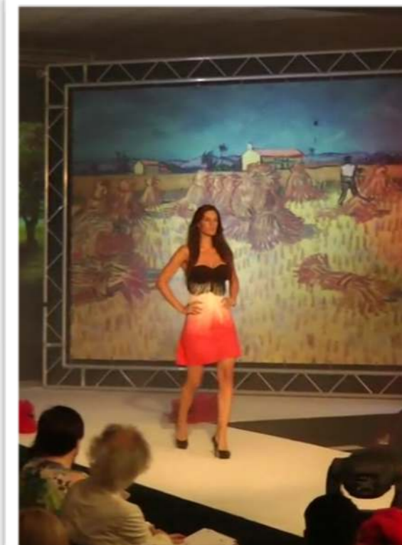
Sfilata per Mulino Moras