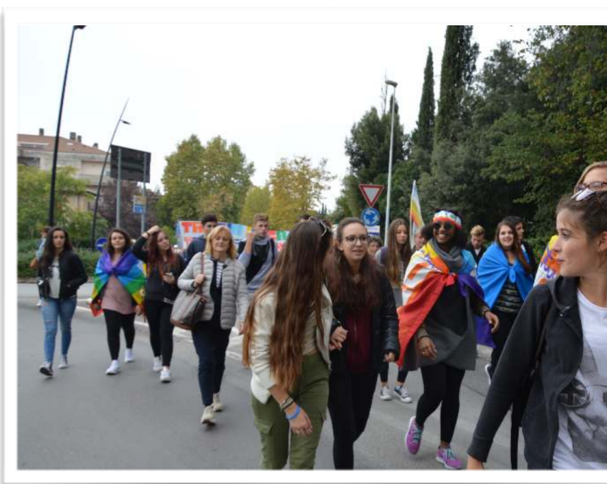
GIOVANI COSTRUTTORI DI PACE Marcia della Pace