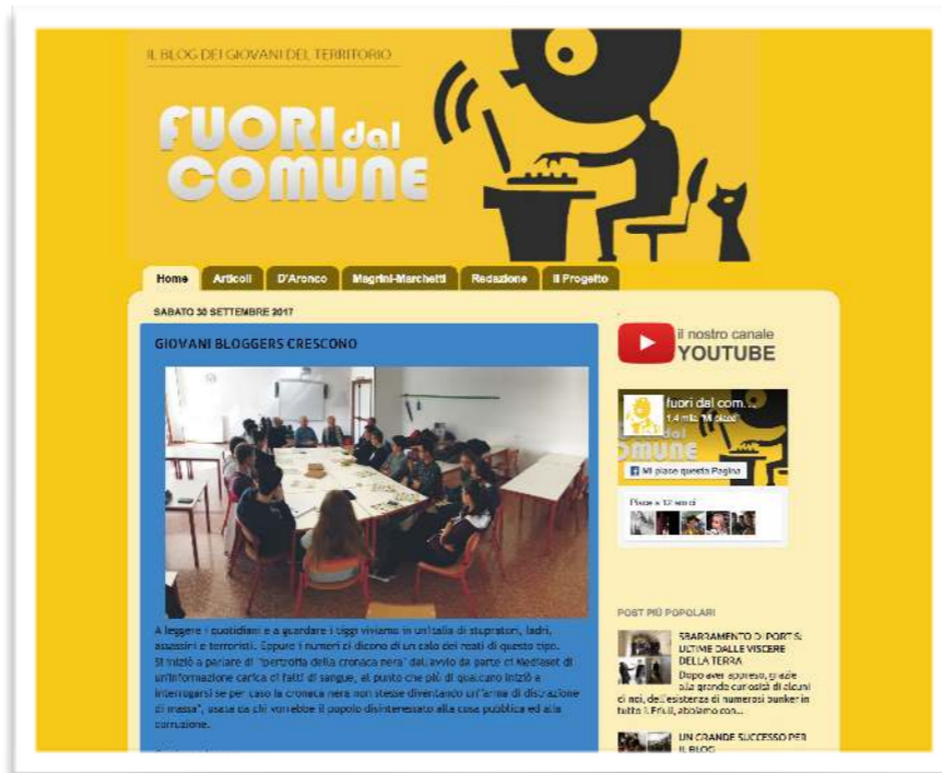
BLOG "Fuori dal comune"