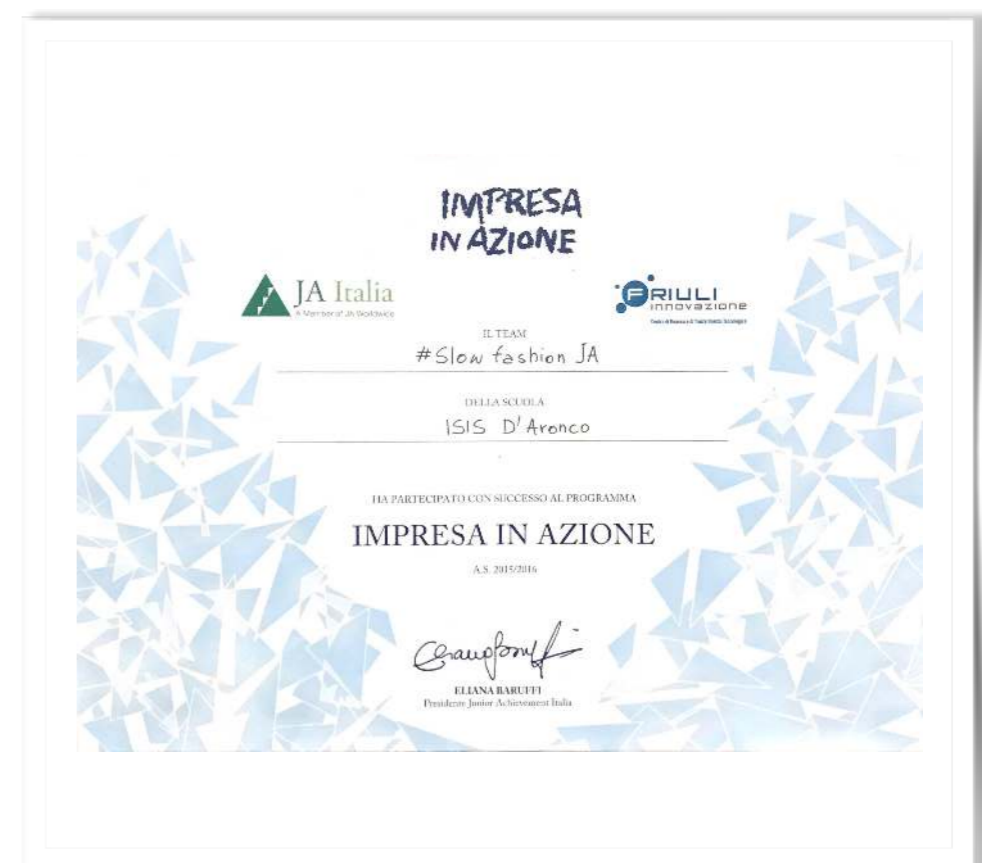
Impresa in azione Slow Fashion