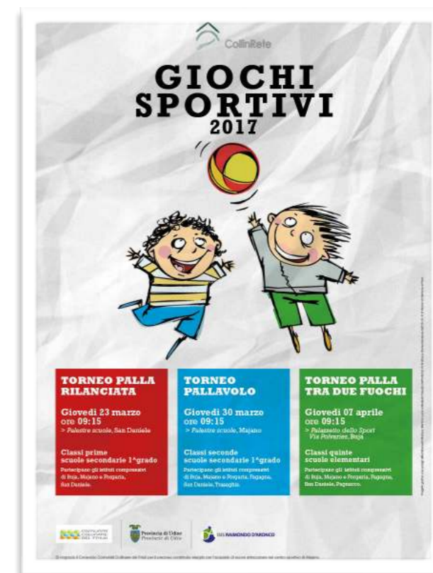
Manifesto "Giochi sportivi" COLLINRETE