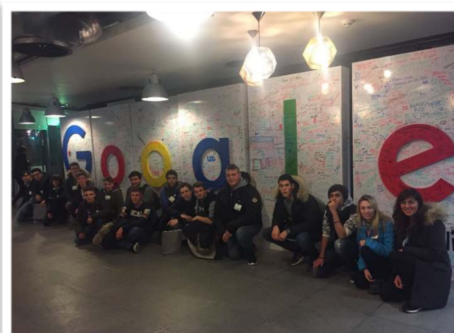
Stage linguistico a DUBLINO