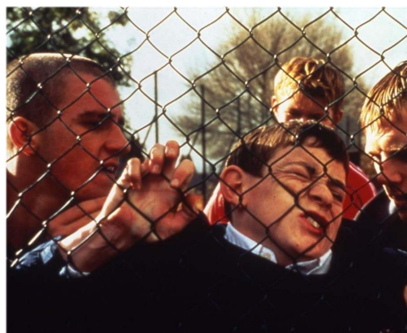
A scuola per conoscerci: isolamento sociale, bullismo e omofobia